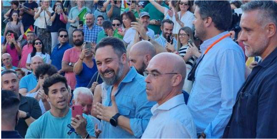
Santiago Abascal y Jorge Buxadé en un mitin electoral en Guadalajara

democracia interna y libertad de expresión; y porque no se pueda decir allí lo que uno piensa. Ha debido olvidar que eso es la base de la democracia.