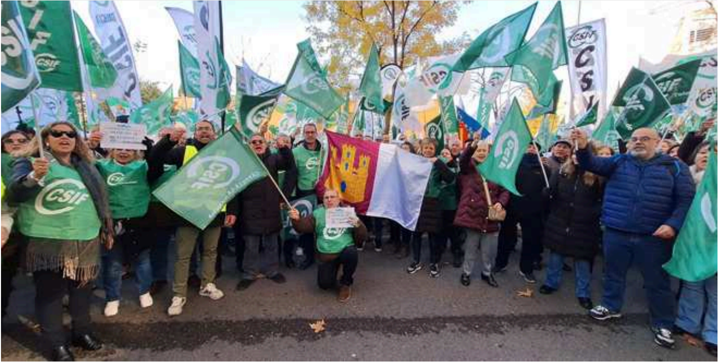
Manifestación de funcionarios para exigir la renovación del convenio sanitario de Muface. En la imagen, la delegación de Castilla La Mancha