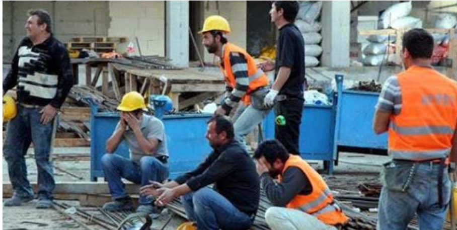
Cuando solo queda llorar por el compañero muerto

En agosto de 2019 pusimos en marcha esta nueva sección con carácter semanal y con vistas a propagar en prensa local y nacional la pandemia de muertes por siniestros laborales que sufrimos en España.