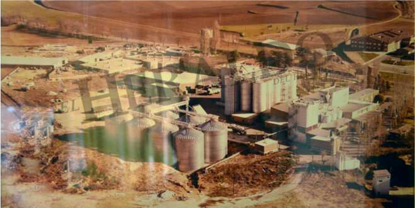
Imagen exclusiva de EL HERALDO DEL HENARES de la fábrica de piensos compuestos de la empresa Avicu. Años 70 del siglo XX