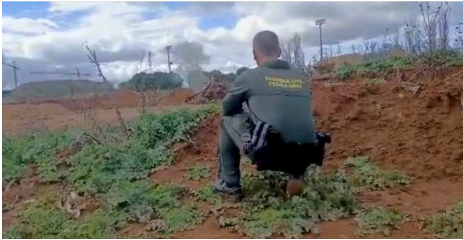
Momento de la explosión controlada de uno de los botes de ácido pícrico retirados

La Guardia Civil retiró el recipiente que contenía unos 25 gramos de ácido pícrico en mal estado de conservación y procedió a su explosión controlada en un lugar seguro, según han informado fuentes del Instituto Armado en un comunicado.