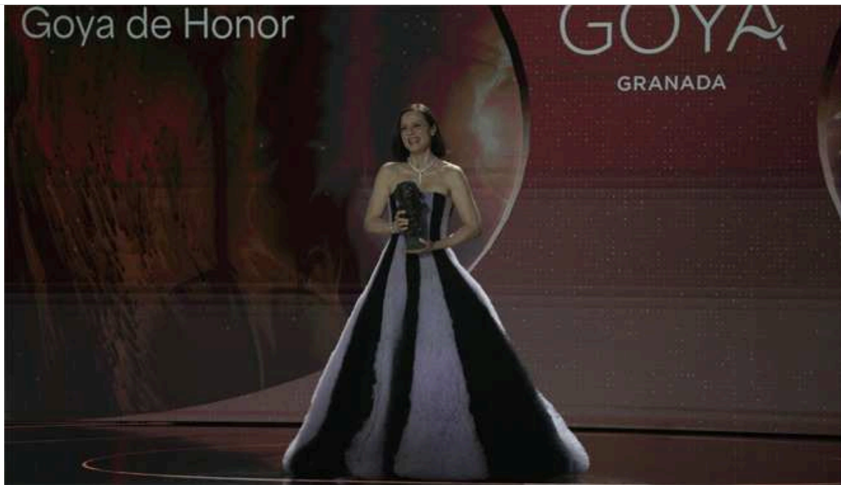
Aitana Sánchez Gijón recibe el Goya de Honor.

Aitana Sánchez-Gijón se ha saltado el protocolo y se ha dirigido a Richard Gere en mitad de la gala de los Premios Goya: "Eres el amor de mi vida" .