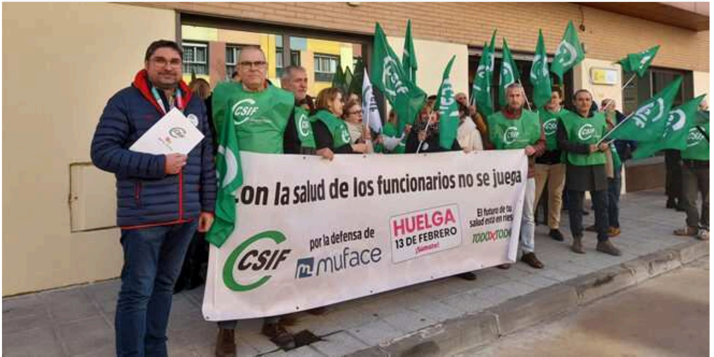
Concentración de CSIF por la renovación del convenio sanitario de Muface a las puertas de la subdelegación del Gobierno de España en Guadalajara