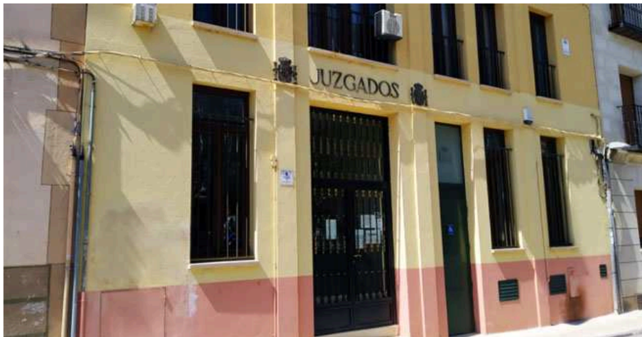
Edificio del juzgado mixto de Sigüenza.

pasan a ser un solo Tribunal de Instancia.