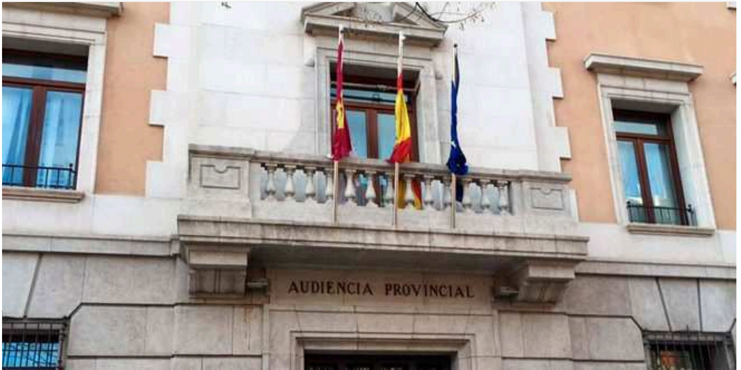
Fachada de la Audiencia Provincial de Guadalajara.