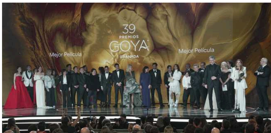
Imagen de familia de todos los premiados en la Gala de los Goya 2025.