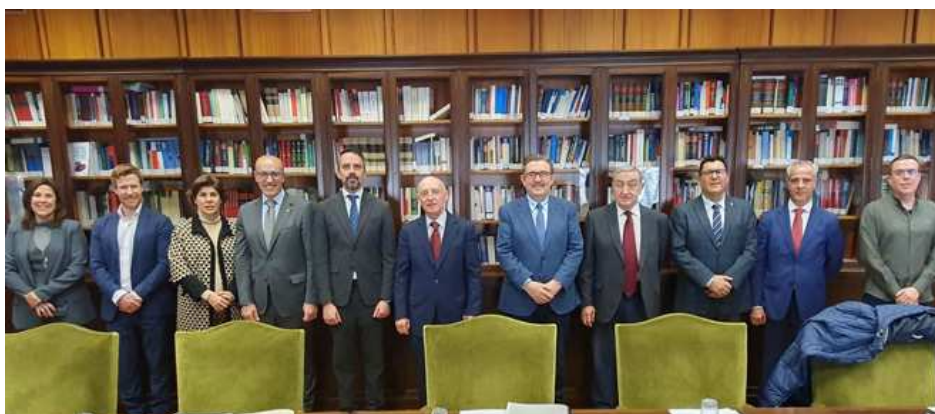
Reunión del secretario de Estado de Justicia en el TSJCLM para hablar sobre la nueva Ley de Eficiencia de la Justicia

«De esta forma, se trata de evitar la sobrecarga de los juzgados y tribunales , limitando su intervención a aquellas causas donde sean imprescindibles, sin que eso implique una merma de los derechos y protegiendo las plenas garantías jurídicas de las partes», han finalizado estas fuentes.