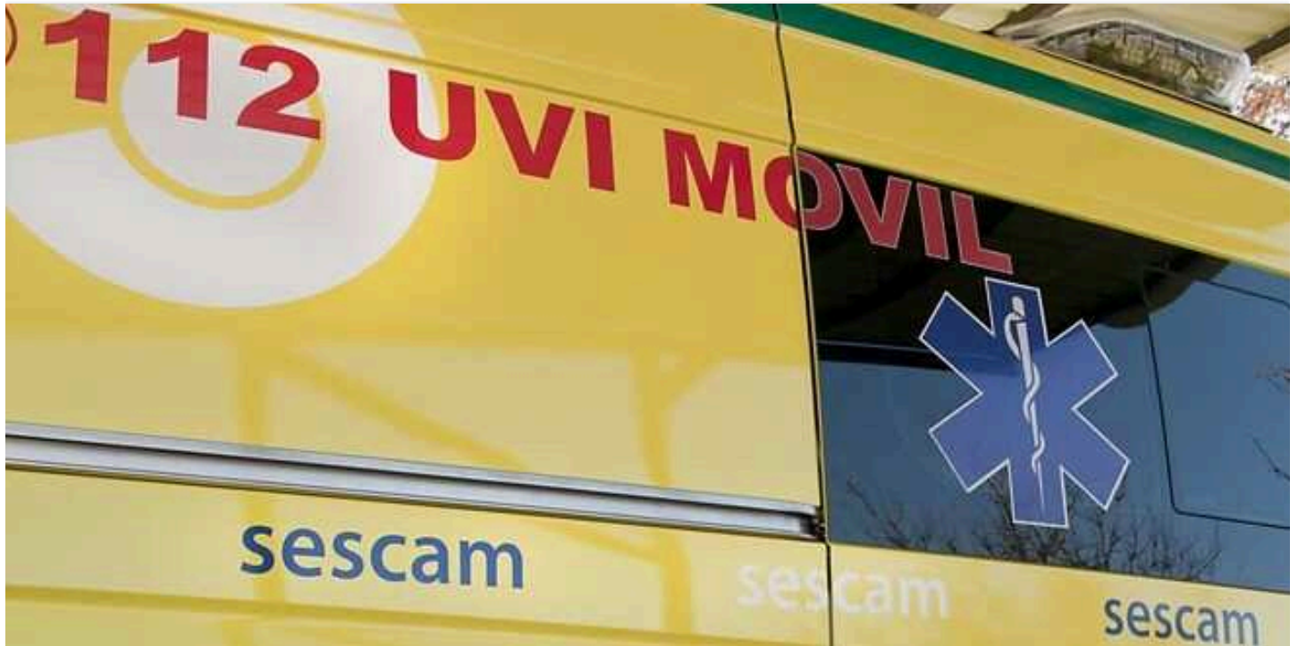
Imagen de archivo de una UVI móvil