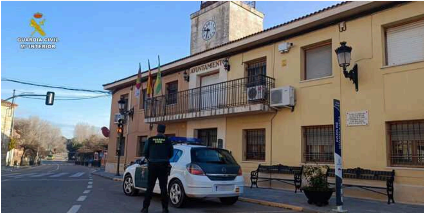
Agente de la Guardia Civil ante el edificio del Ayuntamiento de Pozo de Guadalajara