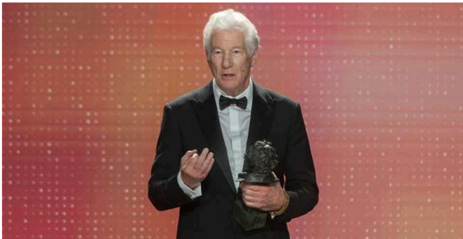
Richard Gere recibe el Goya Internacional.

Antes de la gala, en la alfombra roja, ya hemos vivido momentazos con Antonio Banderas , elogiando a Richard Gere en los Premios Goya: “La gente no le valora tanto por ser guapo, si fuese feo se le valoraría de otro modo” .