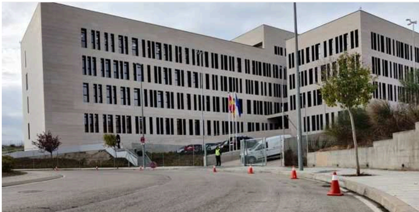
Edificio de los juzgados de Guadalajara