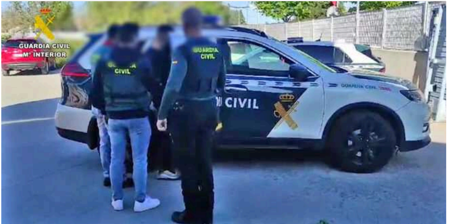
Imagen de archivo de la detención de un hombre por agentes de la Guardia Civil de Azuqueca