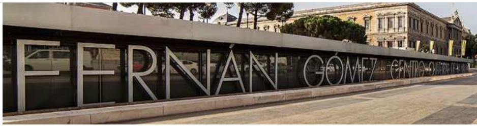
Madrid. Teatro Fernán Gómez