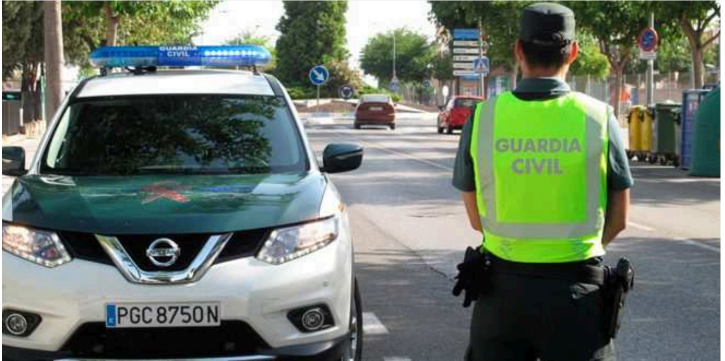
Agente de la Guardia Civil en Azuqueca de Henares