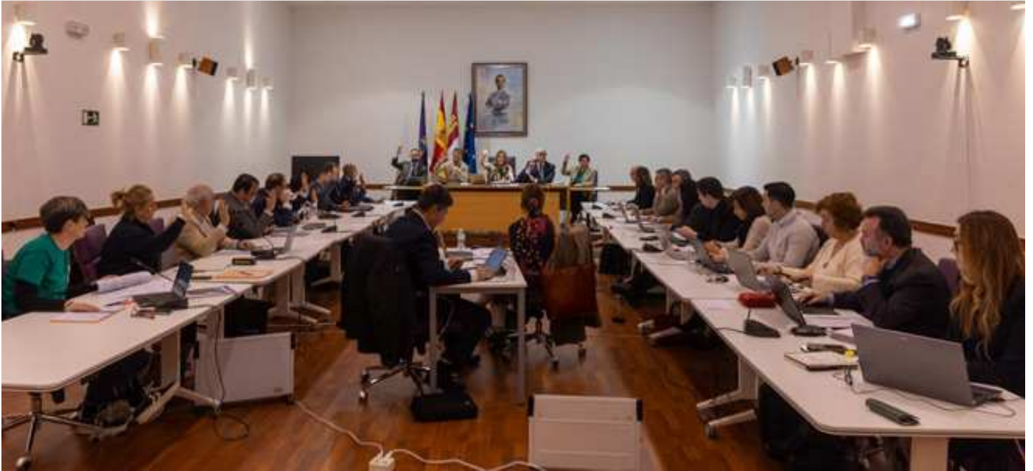
Pleno de presupuestos 2025 del Ayuntamiento de Guadalajara