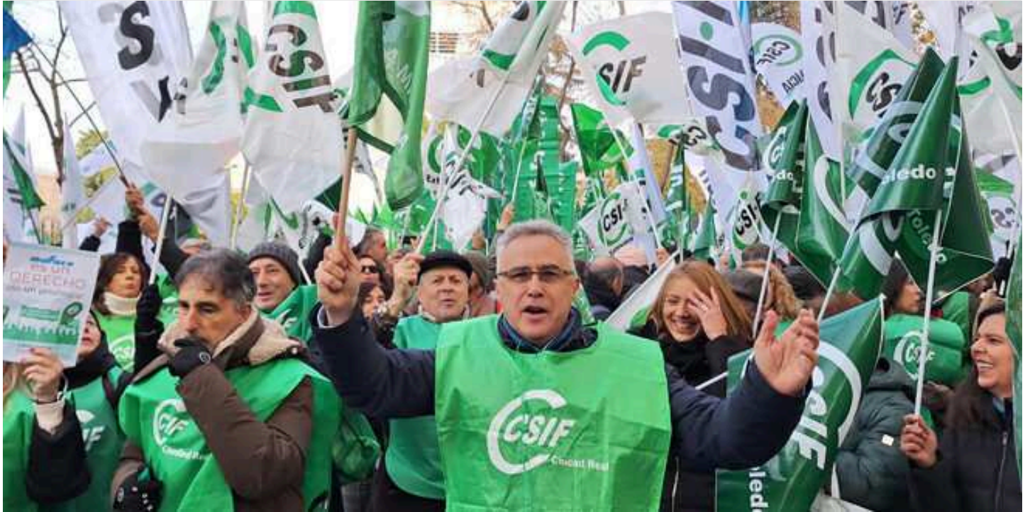
Manifestación de funcionarios para exigir la renovación del convenio sanitario de Muface