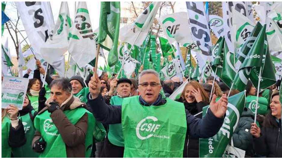
Manifestación de funcionarios para exigir la renovación del convenio sanitario de Muface

El escrito presentado por CSIF recuerda que se han recibido diariamente desde octubre centenares de quejas de mutualistas a quienes les han sido denegadas la realización de pruebas médicas, así como anulación de citas e intervenciones quirúrgicas , «lo que está provocando problemas de salud mental y física tanto en los mutualistas como en sus familias».