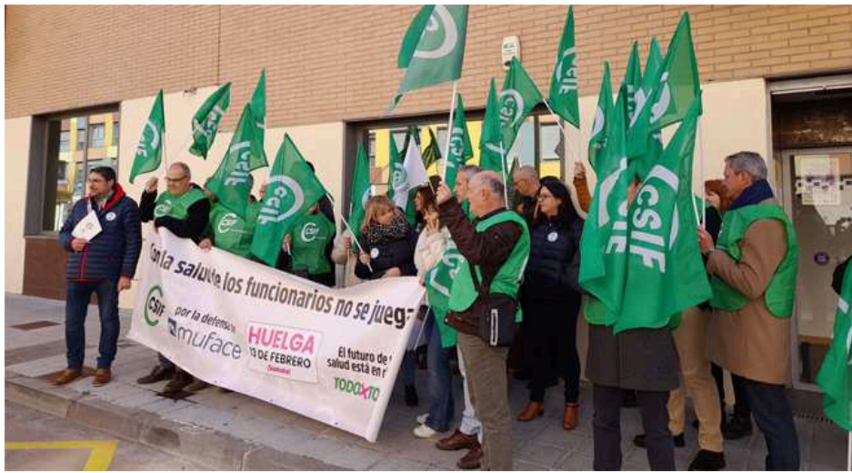
Concentración de CSIF por la renovación del convenio sanitario de Muface a las puertas de la subdelegación del Gobierno de España en Guadalajara

«En este sentido, las concentraciones llevadas a cabo este jueves son un llamamiento al Gobierno y a las aseguradoras para apelar a la responsabilidad que tienen ambas en una crisis que ha llevado al límite el modelo del mutualismo administrativo y ha perjudicado a miles de ciudadanos con temor, miedo, incertidumbre y lo que es incluso más grave, denegación de pruebas, tratamientos o intervenciones quirúrgicas », han señalado.